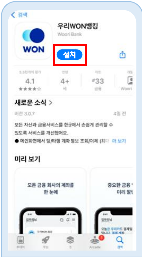
우리WON뱅크 앱 설치