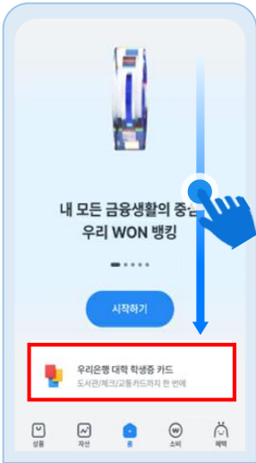
아래로 스크롤 '대학 학생증 카드' 클릭