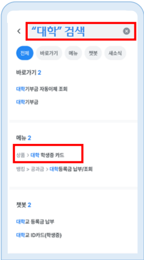
'대학 학생증 카드' 클릭