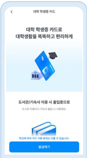
대학 학생증 카드메뉴